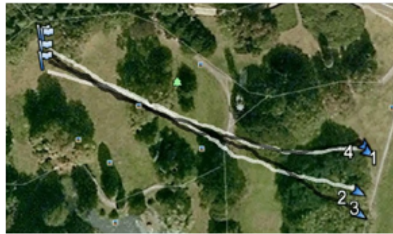
Afbeelding 2. De bewegingen van alle deelnemers gedurende de studie (links) en vier routes van een van de deelnemers (rechts).

bleken er verschillen te zijn voor alle gedragsvariabelen, behalve Afwijking snelheid; wanneer douaniers zichtbaar waren (vergeleken met wanneer ze dat niet waren), ging de Richting van gemiddeld 108,08 naar 100,23 graden, werd de gemiddelde afwijking van die richting hoger (Afwijking richting van 24,99 naar 32,05), ging men meer van de kortste route afwijken (Afwijking kortste route van 13,49 naar 42,38 meter), gingen deelnemers wat langzamer lopen (Snelheid van 1,33 naar 1,29 m/s), en ging men meer afstand houden tot groepsleden (Intergroepsafstand van 7,43 naar 11,85 m).