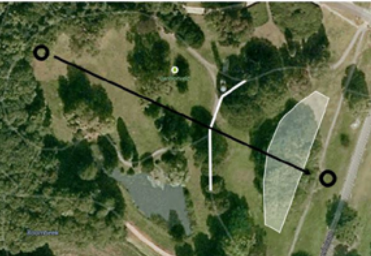
Afbeelding 1. De locatie op de universiteitscampus waar de studie plaatsvond. De twee cirkels geven de start (links) en de finish (rechts) aan. De witte lijn geeft aan waar de douaniers zichtbaar werden voor de smokkelaars; het doorschijnende witte gebied is het grensgebied waar smokkelaars konden worden aangehouden.

was smokkelaar. De smokkelaars moesten zo veel mogelijk legaal (kaarten met 'bloem') en illegaal materiaal (kaarten met 'cocaine') naar een afleverpunt transporteren; douaniers konden hen daarbij onderscheppen in het grensgebied (zie afbeelding 1).