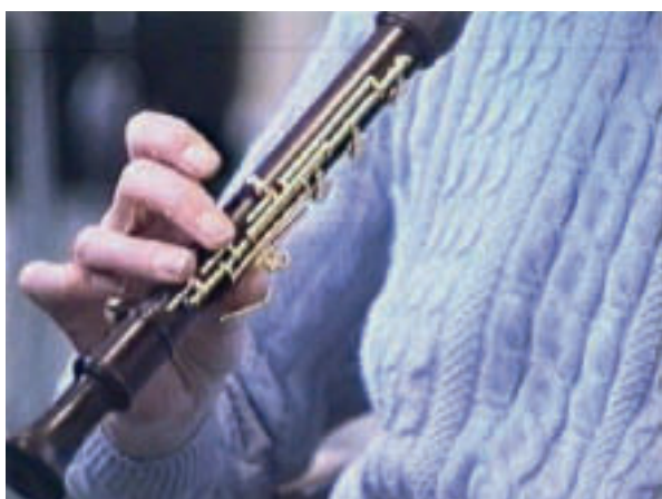
Afbeelding 4. Een eenhandige blokfluit

Strijkinstrumenten. Van vrijwel elk strijkinstrument is een linkshandige en rechtshandige versie beschikbaar. Voor de gitaar en de viool/altviool is dit goed mogelijk door de volgorde van de snaren om te draaien. Bij de gitaar wordt dikwijls een combinatie van een plectrum en plectrumhouder toegepast. Een plectrumhouder is een balletje waarin het gitaarplectrum wordt geklemd; dit balletje is gemakkelijker vast te houden of een andere vorm te geven zodat het aan de hand/pols of onderarm kan worden bevestigd via een orthese.