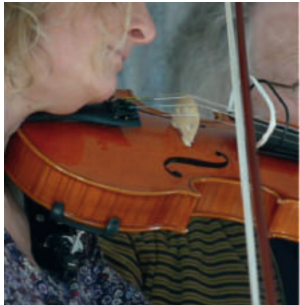
Afbeelding 8a en 8b. De vioolprothese

tieve 'pianoakkoordprothese' is al in 1911 gepatenteerd. Latere, veel verfijndere ontwerpen zijn op dit eerste concept gebaseerd. De onderlinge positie van de drie tanden kan met behulp van een myo-elektrische prothese door de musicus worden gewijzigd. Intensieve training is wel noodzakelijk.