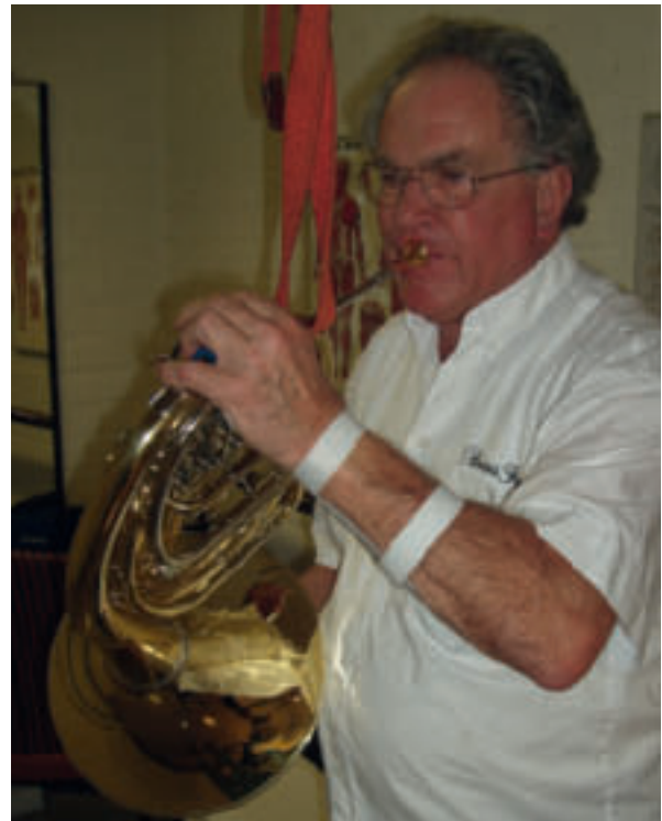
Afbeelding 3. Orthese rond de pols gecombineerd met ophangkoord

gepaste dwarsfluit. Er zijn drie aanpassingen ontwikkeld voor de saxofoon: (1) het geraffineerde schakelsysteem (afbeelding 6a en 6b), (2) een ingenieus kabelsysteem, dat is opgebouwd uit gevlochten kabels in PTFE geleidingsbuizen, en (3) een saxofoon met een vergelijkbare constructie als een normale sax, maar met een andere configuratie van de kleppen waardoor deze voor één hand bereikbaar en te bedienen zijn (ref. 4).