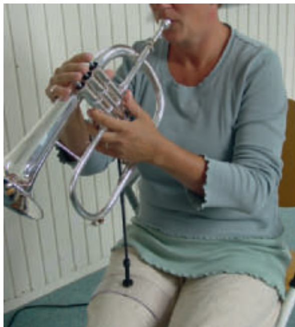
Afbeelding 1a en 1b. Een standaard voor blaasinstrumenten, zoals de trompet