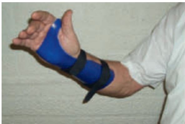
Afbeelding 2. Orthese rond de pols

Blaasinstrumenten. Afbeelding 4 toont een voorbeeld van een eenhandige blokfluit. De blokfluit is voorzien van een klepsysteem, waarmee alle gaten met één hand in één positie kunnen worden afgesloten. Afbeelding 5 toont een aan-