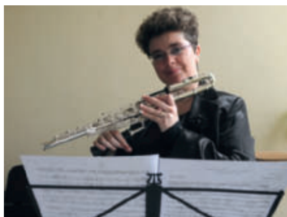
Afbeelding 5. Een aangepaste dwarsfluit