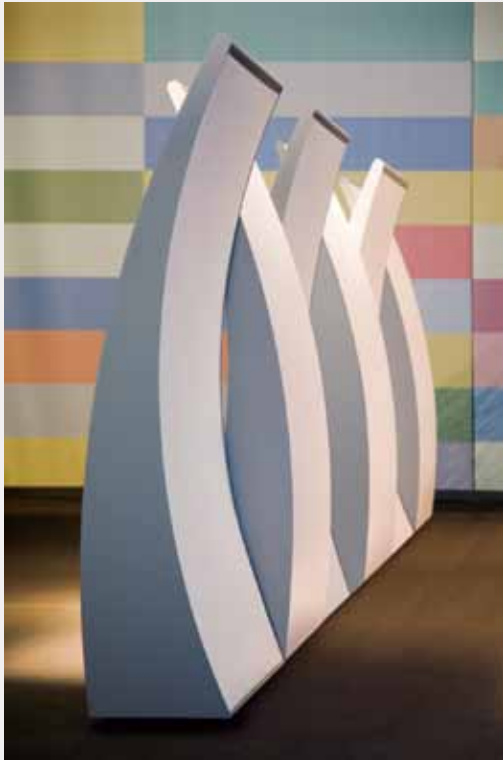
Afbeelding 1. Scheidingswand lineair model