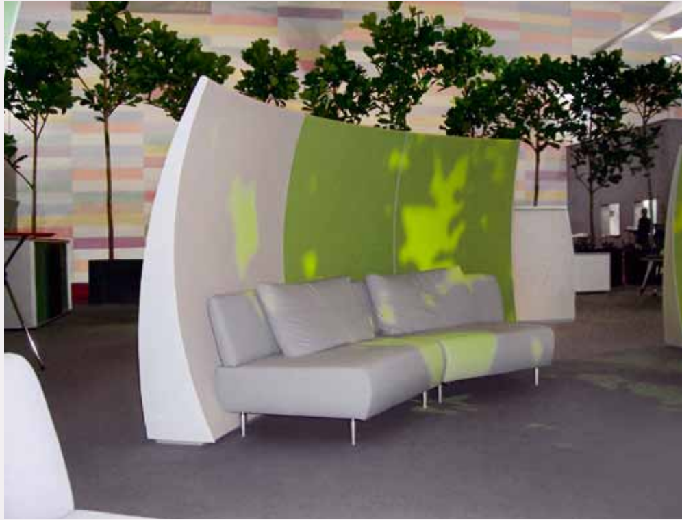
Afbeelding 2. Scheidingswand rond model