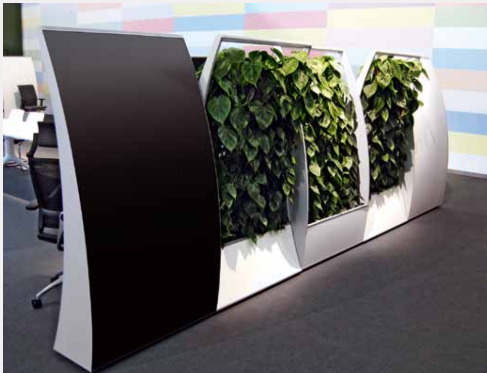
Afbeelding 4. Plantenwand